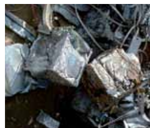
Metalliriomu leikataan ennen paalausta Uddeholm Unimaxista valmistetuilla terillä.

Uddeholm Unimaxista valmistetut terät ovat osoittautuneet kestäviksi sekä metallin että autonrenkaiden käsittelyssä.