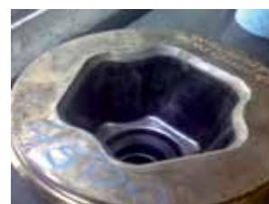
Kuumataontamuotin pesä. Materiaali: Uddeholm Unimax