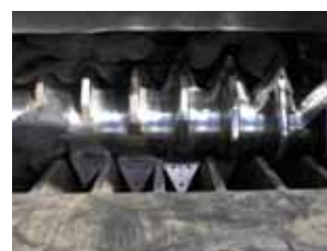
Rengasmurskain. Teräsmateriaali: Uddeholm Unimax