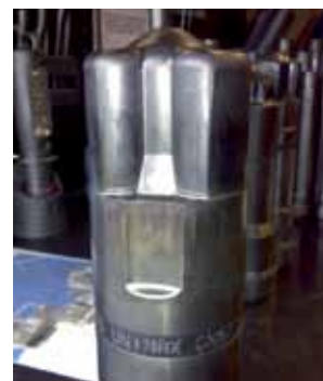
Kuumataontamuotin keerna. Materiaali: Uddeholm Unimax